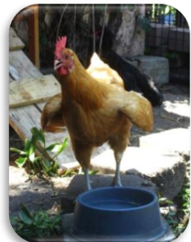
Bec ouvert, ailes écartées : cette poule a chaud!

Les mots-clé pour l'été sont : eau propre, aération et ombre.