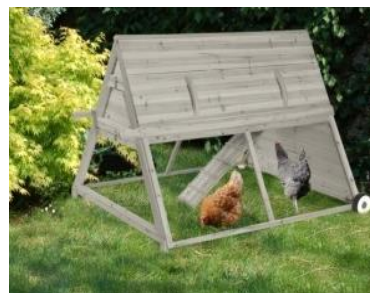
Figure 3 : poulailler mobile