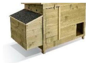
Figure 1 : poulailler sans enclos intégré Figure 2 : poulailler avec enclos intégré

Attention, pour éviter qu'elles ne volent au-dessus de la clôture, il est nécessaire que le grillage ou le mur de l'enclos fasse 1,20m, 1,50 m de haut.