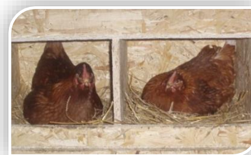
Les poules aiment pondre dans un endroit où elles se sentent comme dans un cocon

Ces petits compartiments, carrés de 30 cm de côté, sont destinés à la pondaison (et à la couvaision lorsqu'i y a présence d'un coq). On compte en moyenne 1 pondoir pour 2 poules, puis 1 pondoir pour 3 poules supplémentaires. En effet, Les poules ne pondent pas en même temps mais à tour de rôle.